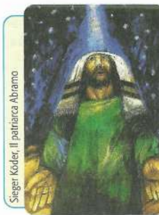
Sieger Köder, Il patriarca Abramo

Via B. Crespi, 30 - 20159 Milano - Tel. 02.345608.1 - Fax 02.345608.36 - Distr. Libreria Ancora Via Larga, 7 - 20122 Milano - Tel. 02.5830.7006 - abbonamenti@ancoralibri.it LA MESSA FESTIVA DEI FEDELI - Settimanale liturgico - N. 15 - Anno 35 - Direttore Responsabile G. Zini - Trib. Milano n. 344 del 6-7-1985 - Prezzo € 0,041 - Stampato su carta riciclata. Imprimatur: in Curia Arch. Mediolani die 4-11-2019, B. Marioni Vic. ep.